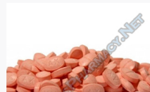
Methanoplex 50 $22.00