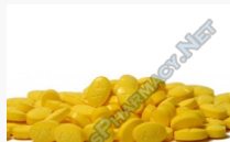
Stanaplex 50 $32.00