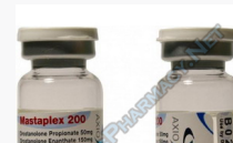
Mastaplex 200 $110.00