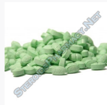
Primoplex 25 $95.00