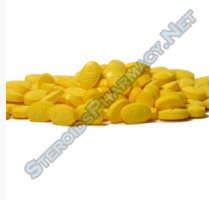
Stanoplex 50 $32.00