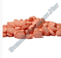
Methanoplex 50 $22.00