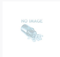
Stanoplex 50 $75.00