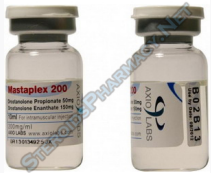
Mastaplex 200 $110.00