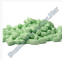
Primoplex 25 $95.00