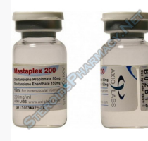
Mastaplex 200 $110.00